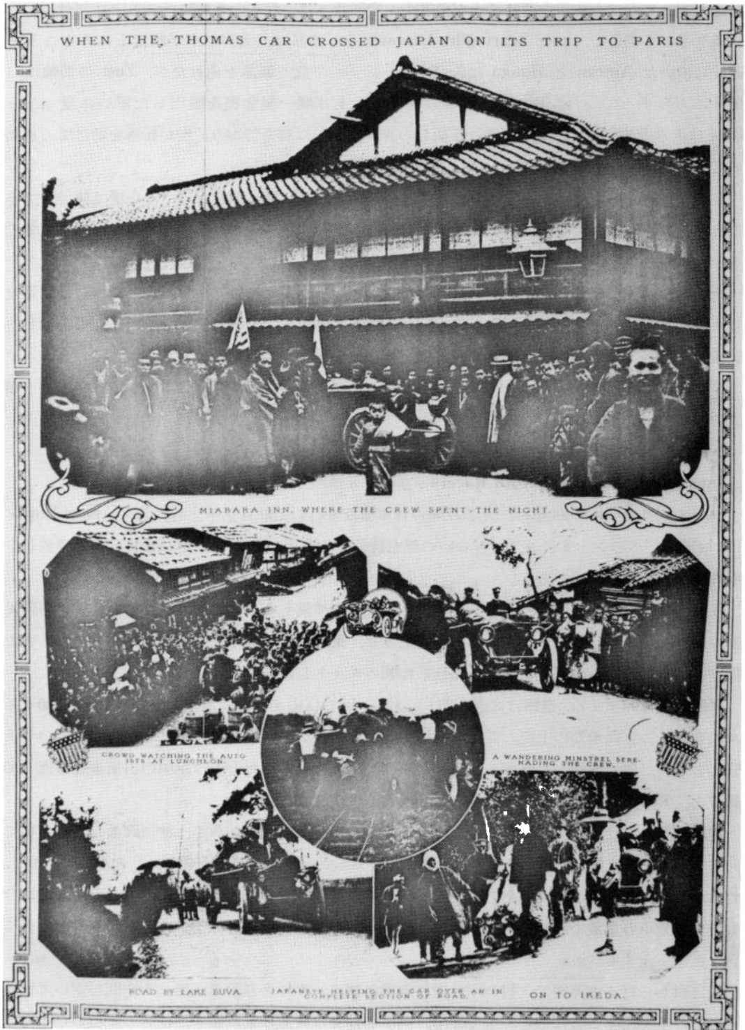
(写真-8) 日本各地でのスナップ写真 (1908年7月19日紙面より)