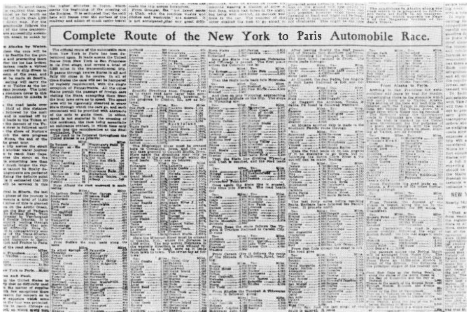
(図表-2) ルート別トータル距離表 (1908年2月9日付紙面より)