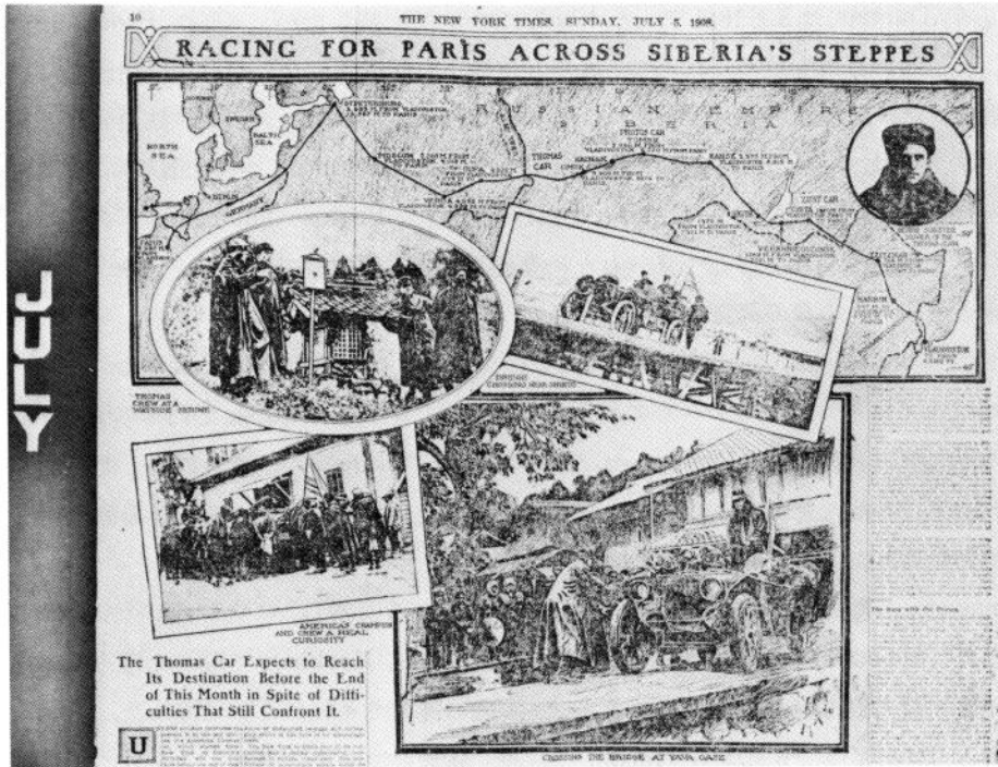
(写真-9) 日本各地でのスナップ写真及びThomas・Protos・Zustの現在地 (1908年7月5日付紙面より)

がらくまで走り続け、3日間で敦賀へ、先にこの島を横断しておえたフランスとイタリアの車に引続いて到着した。